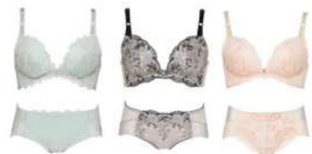
ミント グリーン モーブピンク コーラル